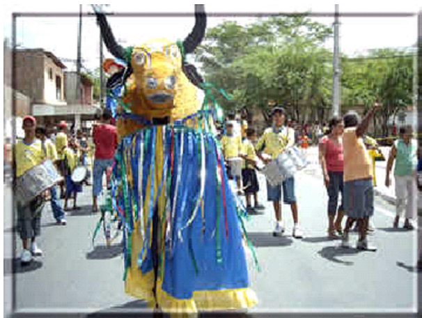
Imagem 05: Boi do carnaval seguido pela batucada

Na época Junina, a escola realiza um desfile de carroças de burro, a “Burreata Neco Cirne”, a festividade faz parte dos festejos de São João da cidade. O evento é coordenado pelo diretor da escola e trouxe uma renovação cultural ao bairro. A “burreata” ocupa as principais ruas do bairro. Todas as carroças são ornamentadas pelos alunos e familiares.